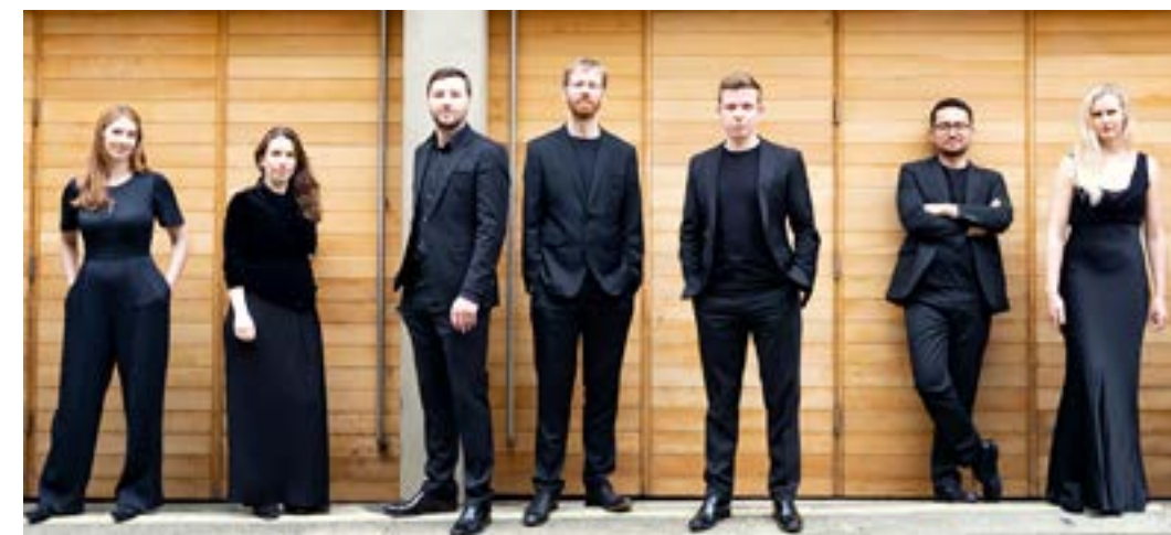
The Marian Consort